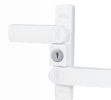
Mechanisch: Tür- und Fenstersicherung